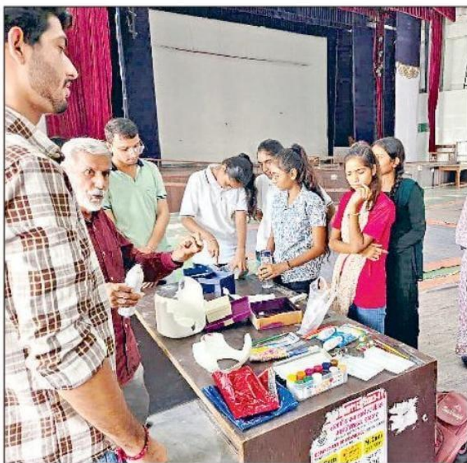
झज्जर। घरेलू कचरा से उत्पाद बनाते हुए विद्यार्थी।