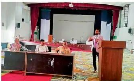
नेहरू कॉलेज में वक्तव्य देते अतिथि।